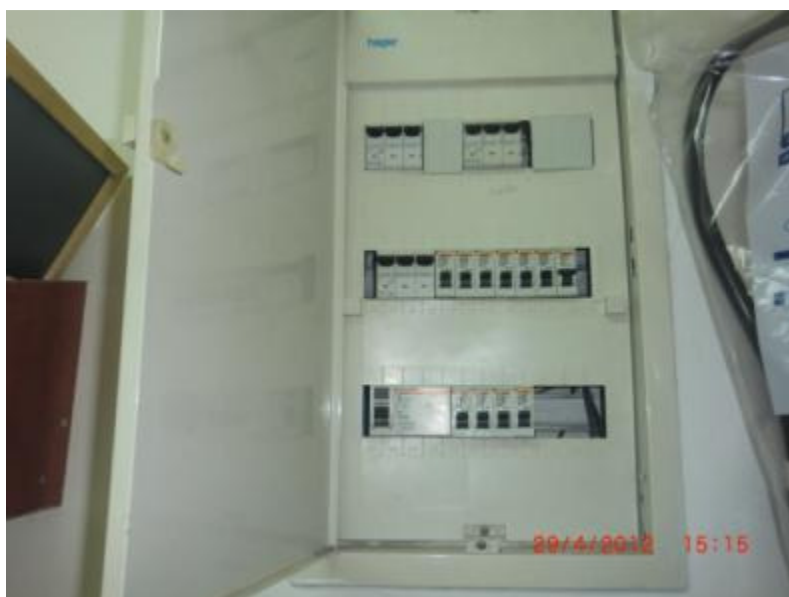
תמונה 2: ארון תאורת חירום בממ"ד